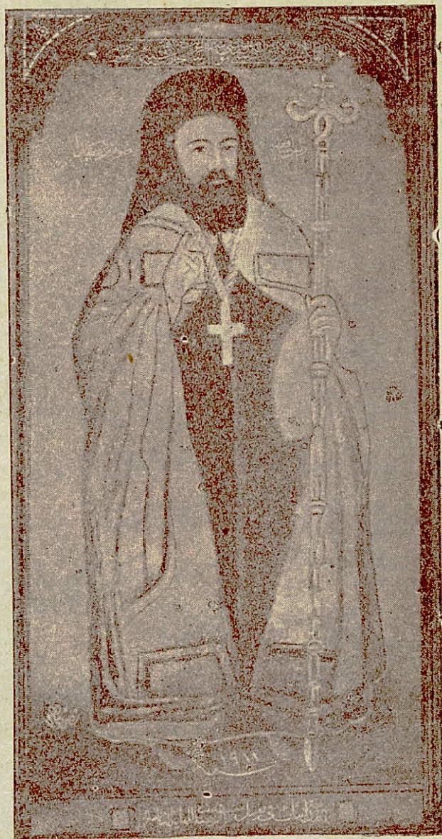
Mgr Euthyme Saïfi Fondateur de l'Ordre de Saint-Sauveur ( 1648-1723 )